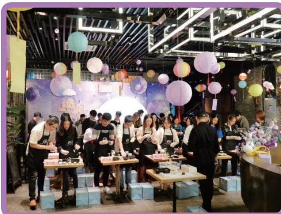
團建旅遊與節日活動