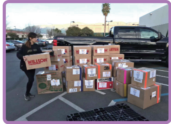
籌備醫療物資捐贈