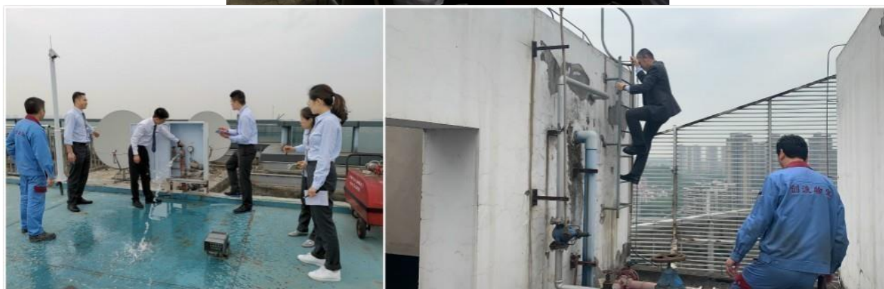
重慶辦公室舉行的消防安全培訓

除了保持工作場所安全，本集團亦提倡員工福祉。為了保持潔淨衛生的工作環境，我們在香港辦公室安裝了濾水器和空氣淨化器，並提醒員工時刻保持辦公場所整潔。在中國內地的業務地區，我們採取了不同的措施鼓勵員工更注重健康生活。我們為深圳辦公室的員工提供符合人體工學的座椅。在報告年度，我們在重慶辦公室舉辦了一場有關預防近視的研討會，以提升員工對視力保健的關注。