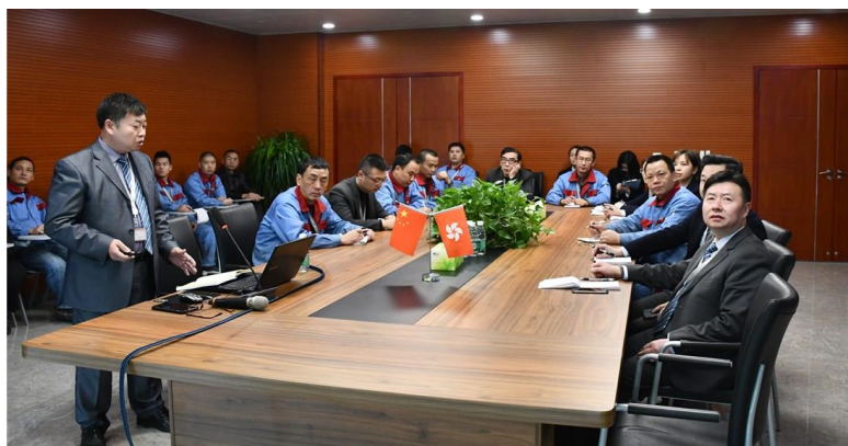
集團舉辦「供電設備管理與維修」培訓班，以培養重慶辦公室的工程人才

為促進員工獲取更多知識和完善個人發展，本集團為員工提供了多元類型的培訓機會。所有新入職員工將接受在職培訓。中國內地業務為新入職員工組織了入職培訓，以加強他們對企業文化和道德操守要求的了解。此外，我們還組織各項培訓活動，藉此提高員工的知識及技能。在 2020 年間，集團分別在香港及中國內地辦公室舉辦了培訓活動。