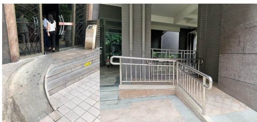
安裝在城市天地廣場（圖左）和雅瑤綠洲（圖右）的增設斜道

集團相信好的建築設計應該包含社會共融元素，不同人士的需求也應該被考慮。有見及此，我們在所有物業安裝了無障礙設施，以提供無障礙通道。例如，我們在出入口增設了斜道，以方便肢體殘障人士及推嬰兒車的使用者。