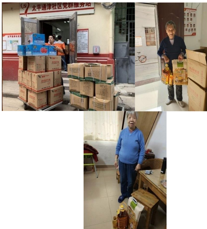
在廣州，我們的義工向獨居老人分發各項生活雜貨，如大米、食用油和水果等

在香港，我們的義工團隊舉辦了探訪鄰近康老中心的活動，如保良局華永會生命教育及長者支援中心以及香港紫雲間沁怡護養院等。在探訪期間，我們向長者派發抗疫物資包，以幫助他們預防感染新型冠狀病毒肺炎。