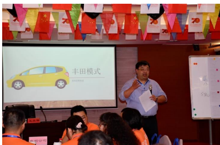
各個營運地區管理層員工參與由集團董事主講的「豐田模式」管理培訓課程