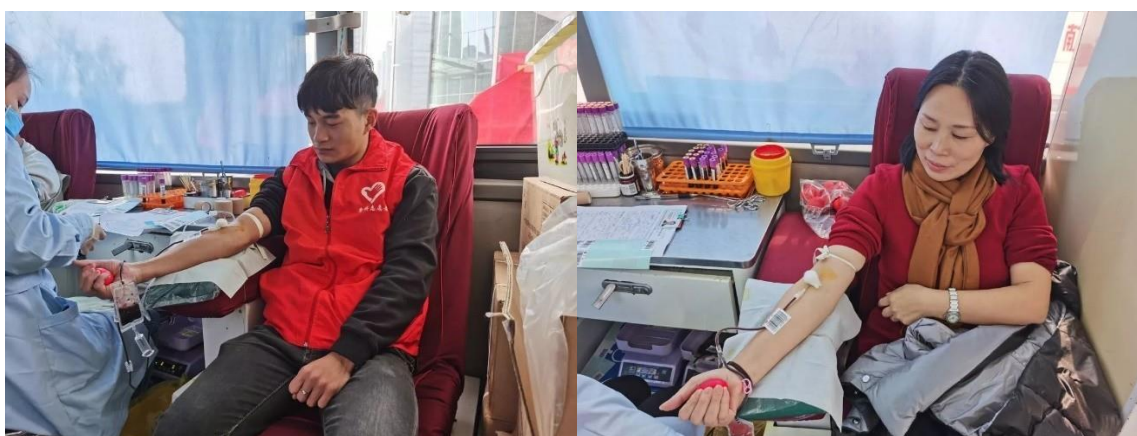
捐血者於流動巴士捐贈血液