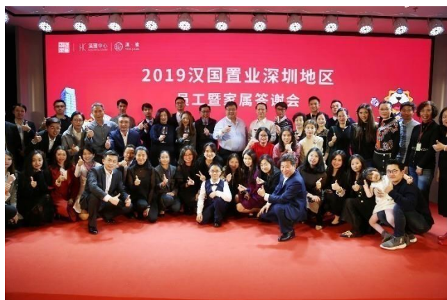
深圳辦公室為員工及其家人舉辦了聖誕及答謝晚宴