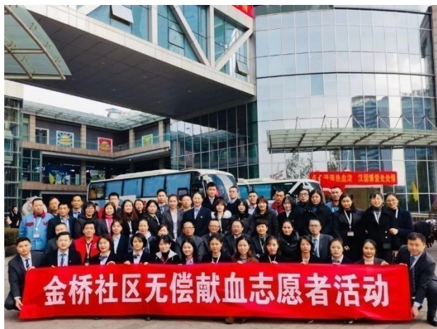
我們的義工參與流動捐血計劃