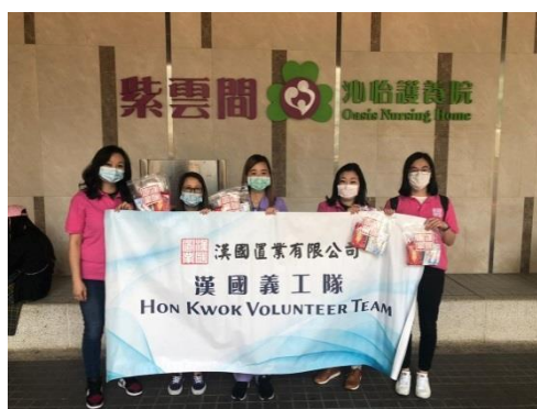
我們的義工探訪保良局華永會生命教育及長者支援中心及香港紫雲間沁怡護養院