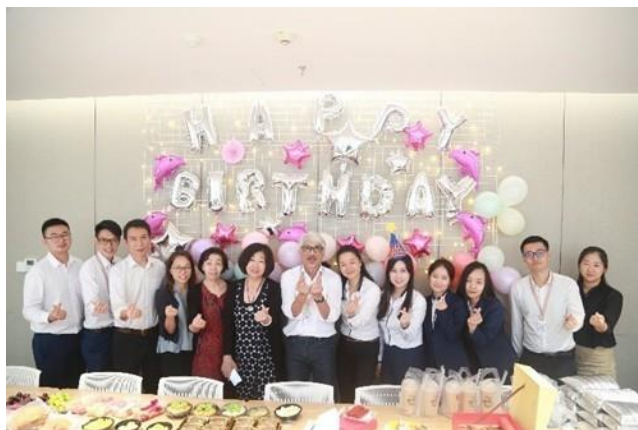
深圳辦公室員工生日派對